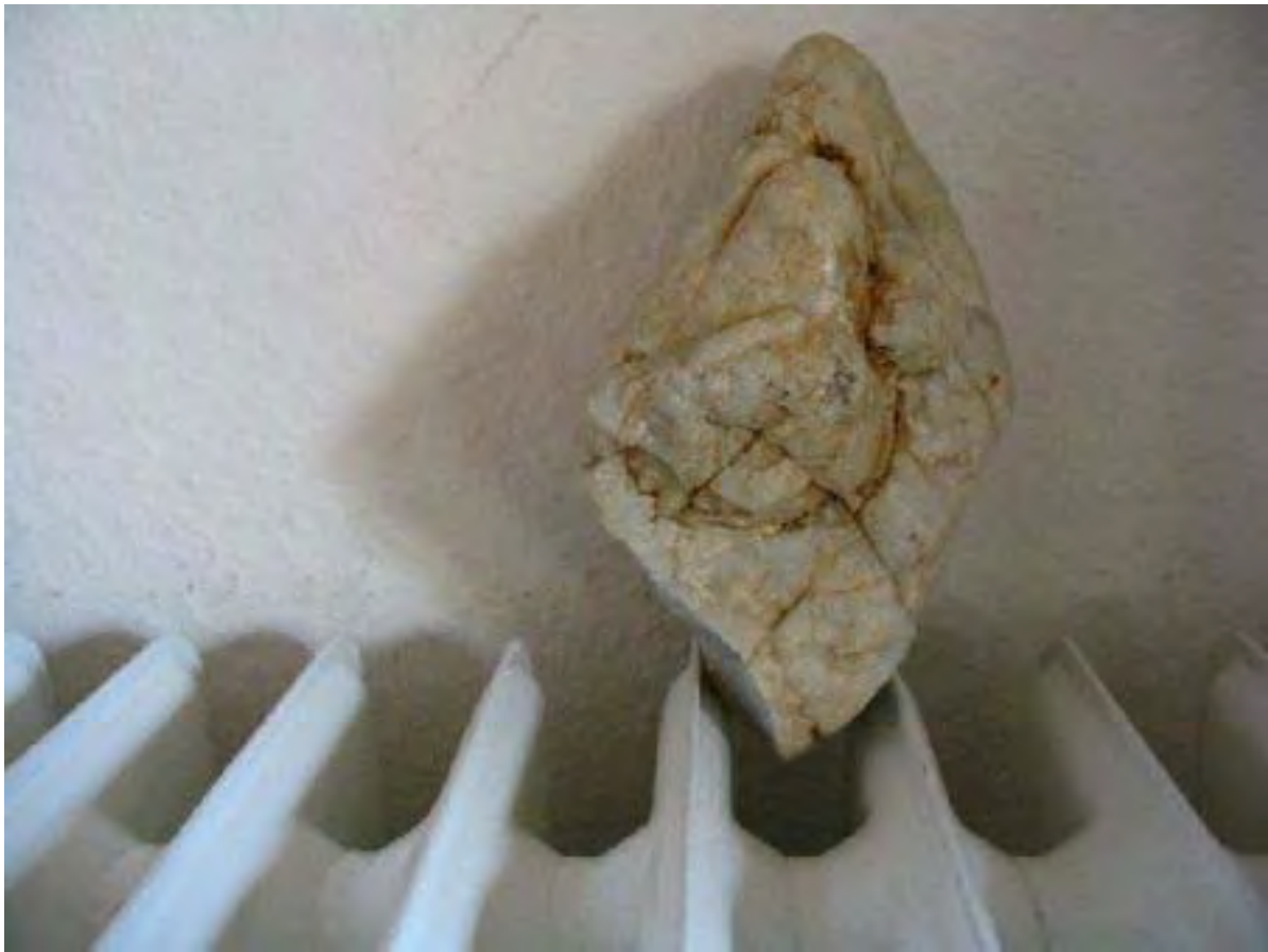
Madonnenfigur auf Heizkörper

Setzt man den Quarzstein einer Wärmequelle aus, so übernimmt er sie sehr schnell. Betastet man nachher die Figuren, so geben sie lebenswarme Wärme weiter.